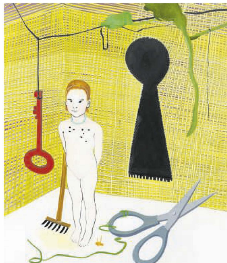
▲ På "De tusind gåders sted" (2006) optræder en lille, nøgen rødhåret pige med hænderne på ryggen.