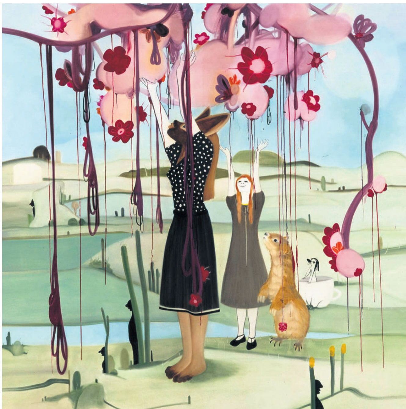
Værket "Overgivelse og hengivelse" fra 2004.

I det rum, hvor det abstrakte og surrealistiske lever side om side med det helt konkrete, sættes tanker og refleksioner på arbejde. Det kan lyde som et hårdt overarbejde, men lad mig understrege, at